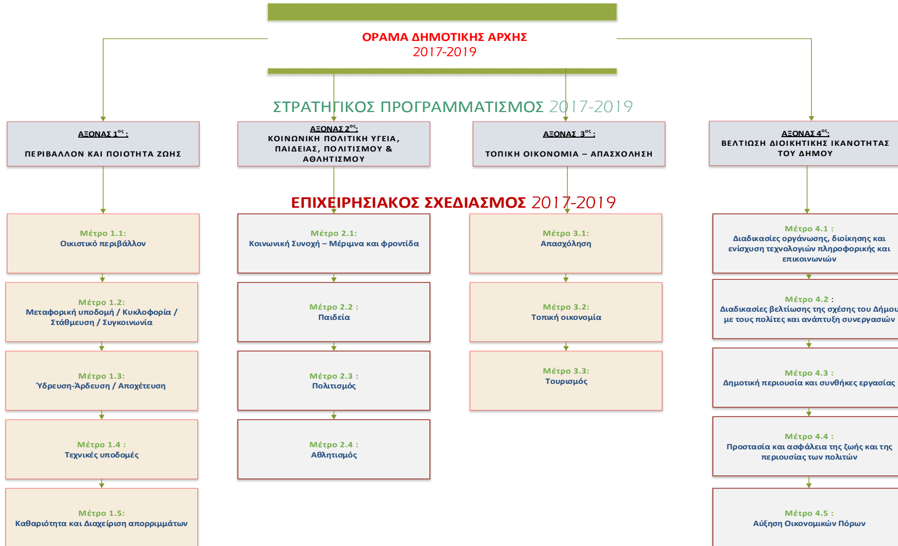
Σχήμα _ 1.